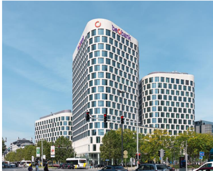
Beobank House, de nieuwe hoofdzetel van Beobank, bevindt zich in de D-toren van het Quatuor-complex. Quatuor Building – SA M. & J.M. Jaspers en J. Eyers & Partners, architecten.

Nieuwe hoofdzetel biedt inspirerende werkplek, is volledig gericht op flexibel en efficiënt werken en onderlinge interactie en bevestigt de duurzame ambities van de bank